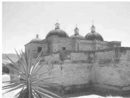
Vista de la Zona Arqueológica y Templo de San Pablo Apóstol

En el Municipio se encuentra el templo de San Pablo Apóstol y el templo en honor del Santo patrón San Pablo, erigido durante el siglo XVI, templo construido sobre una plataforma prehispánica, se accede a él por un espacioso atrio y a través de una portada que luce un arco peraltado con remates piramidales y un nicho; el entablamento que divide los dos cuerpos está decorado y sobre él se abre la ventana del coro.