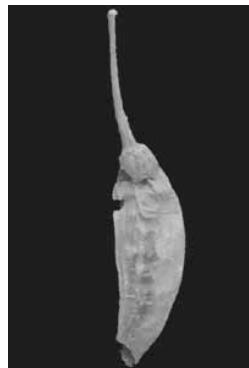
Muestra de Fósil de Chile

A juzgar por el volumen de los materiales depositados en la cueva, los alimentos más importantes eran bellotas de encino, recolectadas en zonas de mayor altitud hacia el norte, y las semillas de mezquite, traídas del fondo del valle hacia el sur.