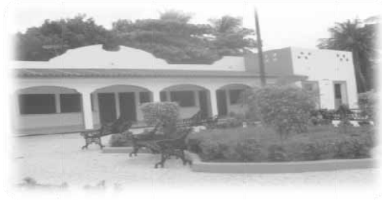
5 cuartos comerciales.