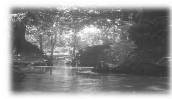
Ojo de agua, motor de la actividad terciaria, Mas del 40% de la PEA.

Dentro de los límites territoriales se encuentran tres manantiales de aguas cristalinas conocidas como "Ojo de Agua".