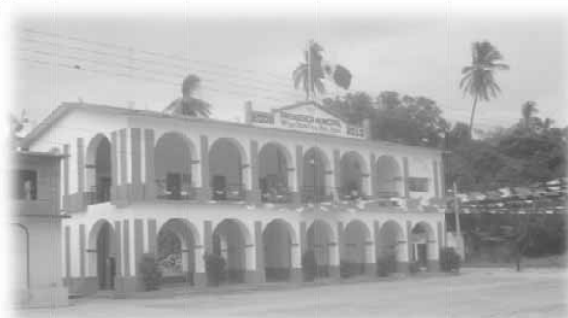
El palacio municipal que se encuentra en el centro de la población da servicio por las tardes.