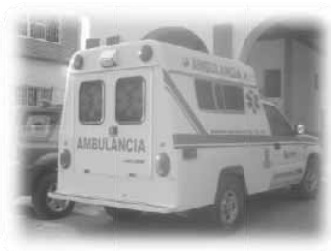
Una ambulancia clásica, tipo silverado modelo 2006.