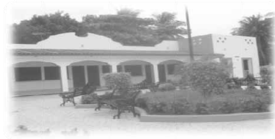
Áreas verdes, cercanas al palacio.

No cuentan con espacios especiales para sus reuniones, estas se llevan a cabo en la explanada del palacio municipal y en la oficina de la Comisaría Ejidal o en la de Bienes Comunales.