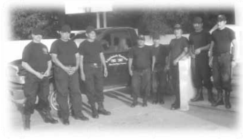
Cuerpo de policías municipales.