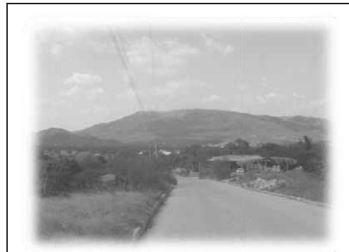
ENTRANDO POR TLACOTEPEC, AL FONDO "EL TABLON". MONTAÑA QUE SIRVE DE BARRERA PARA LOS FUERTES VIENTOS, EVITANDO DEMASIADA CAIDA DE FRUTOS DE MANGO.

Dentro de los límites territoriales se encuentran tres manantiales de aguas cristalinas conocidas como "Ojo de Agua".