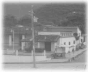
Una biblioteca municipal.