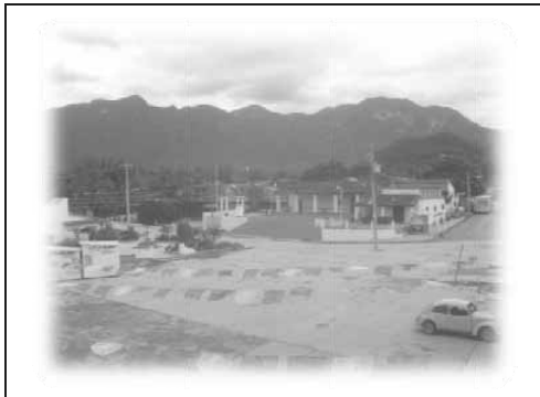
EXPLANADA PRINCIPAL, AL FONDO "EL INDIJO DORMIDO". CON UNA ALTITUD MAXIMA DE 1200MSNM, CON PRESENCIA DE SELVA ALTA PERENIFOLIA EN ZONAS DETERMINADA.

El mapa nos describe que Santiago laollaga es el limite de la planicie costera del istmo, es decir allí acaba los terrenos planos y comienza la serranía.