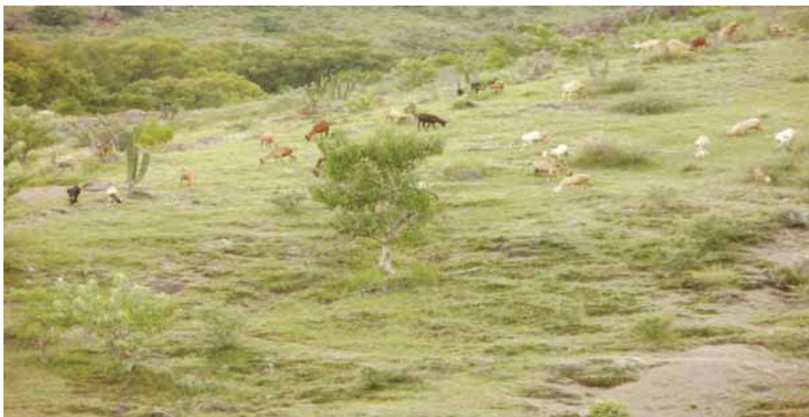
Ganado caprino al libre pastoreo.

plantas arbustivas y arbóreas, como resultado de la apertura de las tierras a la agricultura que después se abandonaron y dedicaron al libre pastoreo.