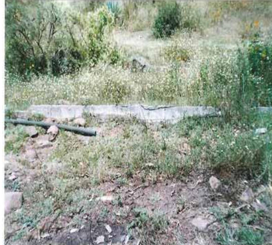
Nivel de mantenimiento en que se encuentran los canales de las unidades de riego.