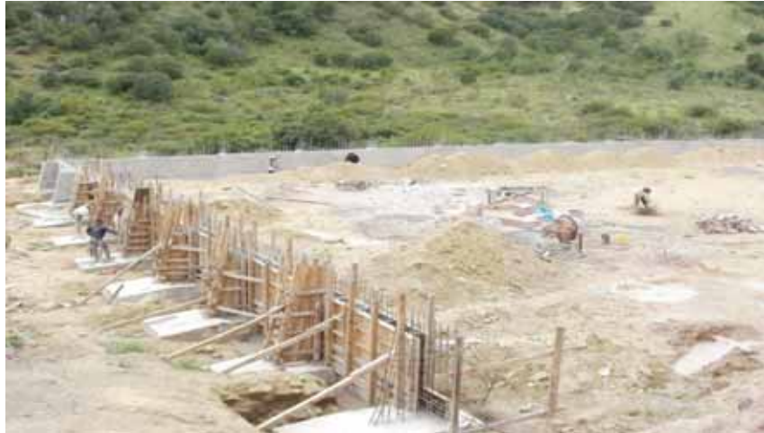
Primera etapa de la Construcción del Relleno Sanitario (actualmente en proceso).

Durante la presente administración, se continuaran realizando las gestiones ante las diferentes instancias gubernamentales, para concluir la construcción de dicha infraestructura con la que se mejorara el medio ambiente del municipio y la región.