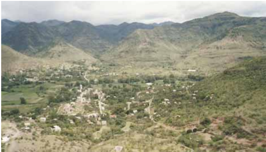
La cañada y la montaña

Aunque no existe gran diversidad de fauna silvestre es destacable el aprovechamiento no ordenado que existe por la cacería de mamífero particularmente del venado cola blanca; en cuanto a otros recursos como el suelo se ha visto afectado en forma negativa ya que la ganadería se realiza al libre pastoreo, tanto de ganado vacuno como caprino, esta última es la que más lo ha deteriorado y afectado principalmente al incrementar el proceso erosivo.