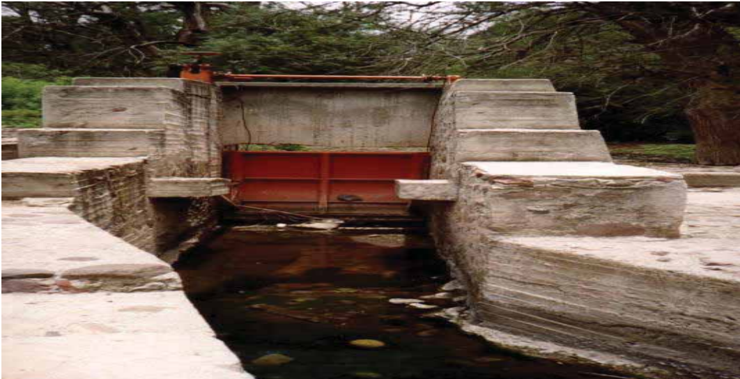
Presas Derivadora sobre la margen derecha del Rio Mixteco

en el río Mixteco, tiene canales revestidos de tipo trapecial, de mampostería y canaleta R-45 en una longitud de 5 Km., aunque el mantenimiento ha sido muy deficiente y el canal principal se encuentran muy deteriorados ya que solo se le proporciona mantenimiento ocasionalmente y de manera parcial, siendo la única infraestructura productiva existente, las otras unidades de riego, solo derivan el agua de los arroyos existentes hacia las diversas parcelas y no existe la infraestructura como tal.