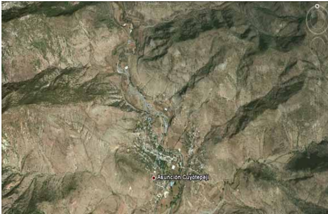
Asunción Cuyotepeji, Oax.