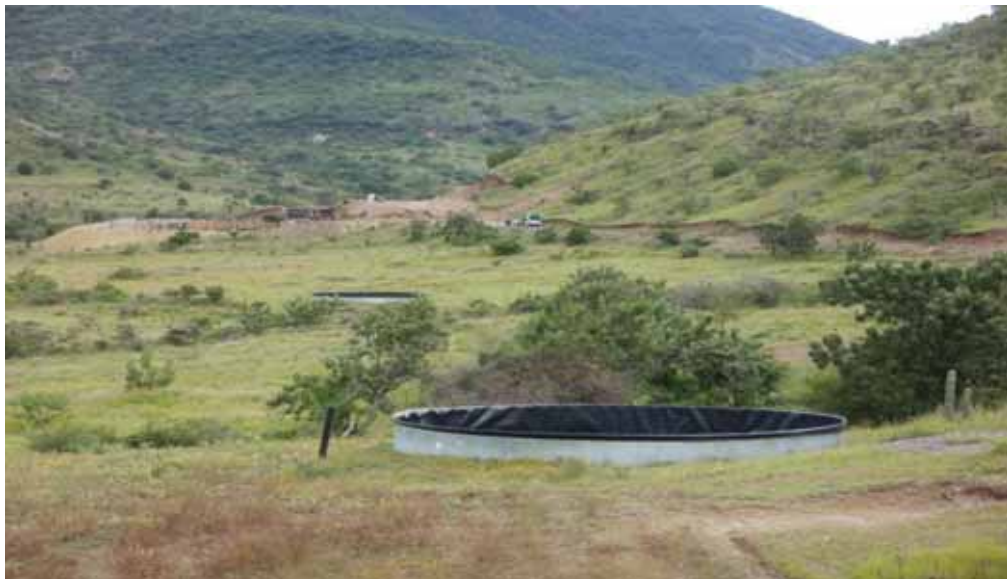
Dos tanques acuícolas semi abandonados, al fondo relleno sanitario en construcción.

A partir del año 2007 se tuvo la oportunidad de acceder a apoyos de los programas de la SAGARPA y de otras instituciones habiéndose incrementado el número de unidades dedicadas a la producción acuícola, pero en este caso, por falta de dedicación no se logró elevarla de manera significativa, pero existe amplio potencial para ello, requiriéndose apoyos financieros y técnicos mediante la capacitación además de sensibilización de los poseedores de estos activos para diversificar la producción de alimentos y mejorar los ingresos.