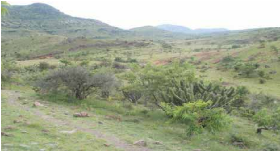
Restos de selva baja perturbada por la actividad ganadera.

b) Selva baja caducifolia la vegetación crece en el Municipio bajo la influencia del clima semicálido de baja humedad, con lluvias en verano. Sin embargo este tipo de vegetación presenta un alto grado de disturbio debido a la extracción de leña con fines domésticos, pastoreo de ganado caprino y bovino y a la agricultura. Algunos elementos que han sido favorecido con estos disturbios son: constituido por huizache, tehuixtles cazahuate, jiotillos y otras especies no maderables.