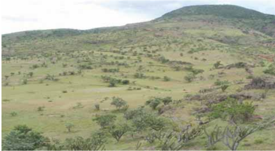
Pastizal donde se desarrolla la ganadería al libre pastoreo

b) Selva baja caducifolia la vegetación crece en el Municipio bajo la influencia del clima semicálido de baja humedad, con lluvias en verano. Sin embargo este tipo de vegetación presenta un alto grado de disturbio debido a la extracción de leña con fines domésticos, pastoreo de ganado caprino y bovino y a la agricultura. Algunos elementos que han sido favorecido con estos disturbios son: constituido por huizache, tehuixtles cazahuate, jiotillos y otras especies no maderables.