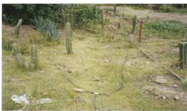
Condiciones en las que se encuentra la red de agua entubada y riego a una parcela agrícola.

Existen siete Asociaciones de Usuarios de Unidades de Riego que cuentan con Títulos de Concesión para aprovechamiento de las aguas nacionales y son las siguientes: 1.) La Unidad de Riego Yundoo Margen Izquierda tiene un padrón de 53 productores y una superficie agrícola regable de 22 hectáreas. 2.) La Unidad de Riego Yundoo Margen derecha cuenta con un padrón de 87 productores y 42 hectáreas que aprovechan las aguas de una Presa Derivadora en el río Mixteco. 3) La Unidad de Riego La Cueva tiene un padrón de 14 productores con una superficie de 8 hectáreas que aprovechan las aguas de una galería filtrante en el río La Junta y conducen el agua con manguera Negra de tres pulgadas. 4) La Unidad de Riego Chicatodo tiene un padrón de 4 productores con 4.5 hectáreas. 5) La Unidad de Riego El Aguacate con 8 productores y 4 hectáreas. 6) La Unidad de Riego Cahuadanza tiene 7 productores y 4 hectáreas. y 7) La Unidad de Riego Cahuafanchi con 5 productores y 3 hectáreas de riego. De igual manera, la falta de mantenimiento y organización de los productores reducen la eficiencia en el aprovechamiento de este recurso.