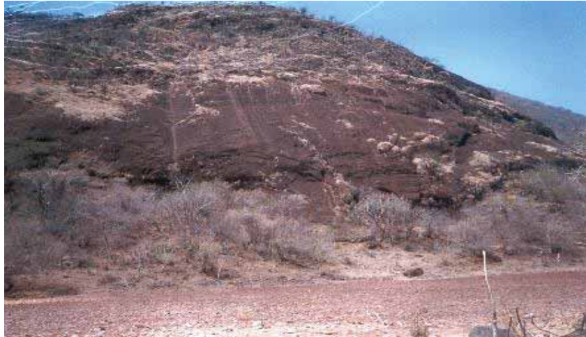
Cantera rosa, recurso mineral que no se explota eficientemente.

cultura minera, la población no muestra interés sobre estos posibles recursos; de manera superficial se explota y el comisariado de Bienes Comunales ha obtenido algunos ingresos por la venta de cantera rosa que se encuentra de manera superficial al pie del cerro Cuyotepeji, cercana a la zona urbana del municipio y que se utiliza para la construcción de bardas.