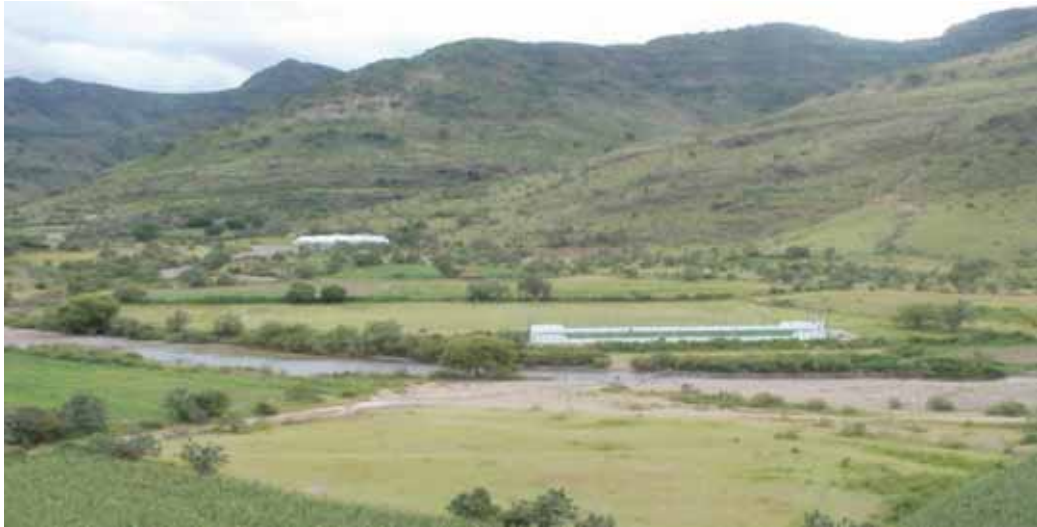
Área donde se practica deporte y cancha de fútbol rápido.