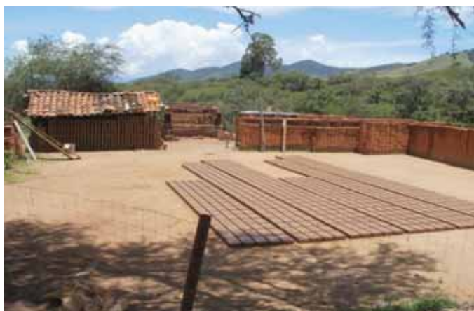
Taller donde se fabrica tabique

El crecimiento económico del municipio puede centrarse en las actividades sector agropecuario y forestal en donde tiene potencial natural para crecer, aunque para ello requerirá de estudios, la apertura de caminos, capacitación e inversiones para el crecimiento y desarrollo municipal.