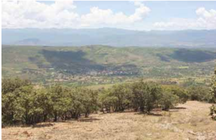
Relictos de bosque de encino, al fondo San Jerónimo Silacayoapilla.