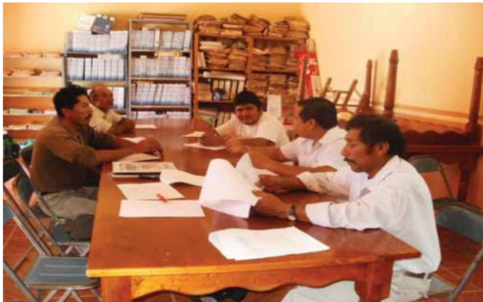
Reunión con el médico de la UMR-IMSS, en donde comparte información sobre la salud del municipio a considerar en el PMDS (03-08-11)