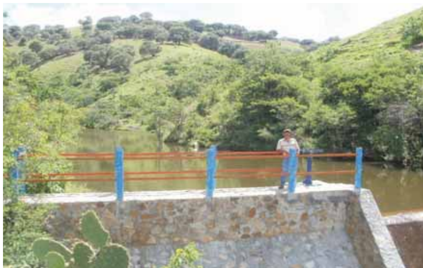
Represa donde se puede desarrollar la acuicultura.

En el año 2007 se terminó la construcción y entro en operación una represa con apoyo de la Comisión Nacional de Zonas Áridas (CONAZA), con una superficie de 5 hectáreas, el propósito es de que en la época de estiaje, se cuente con agua para uso doméstico en la comunidad de Tejaltilan, abrevadero del ganado y para el cultivo de mojarra tilapia, este último propósito no ha sido posible consolidar debido en cierta forma a la apatía del comité que no solicita la asistencia técnica y no lo siente como una necesidad emprender esta actividad, su aprovechamiento y desarrollo tendría ventajas competitivas en la región.