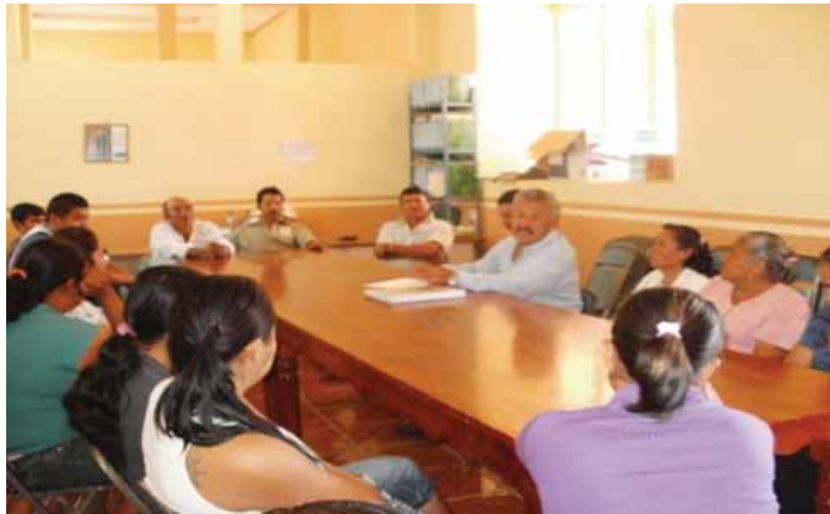
Reunión con los Comités de Salud y Educación del municipio y barrios del municipio (26-07-11)