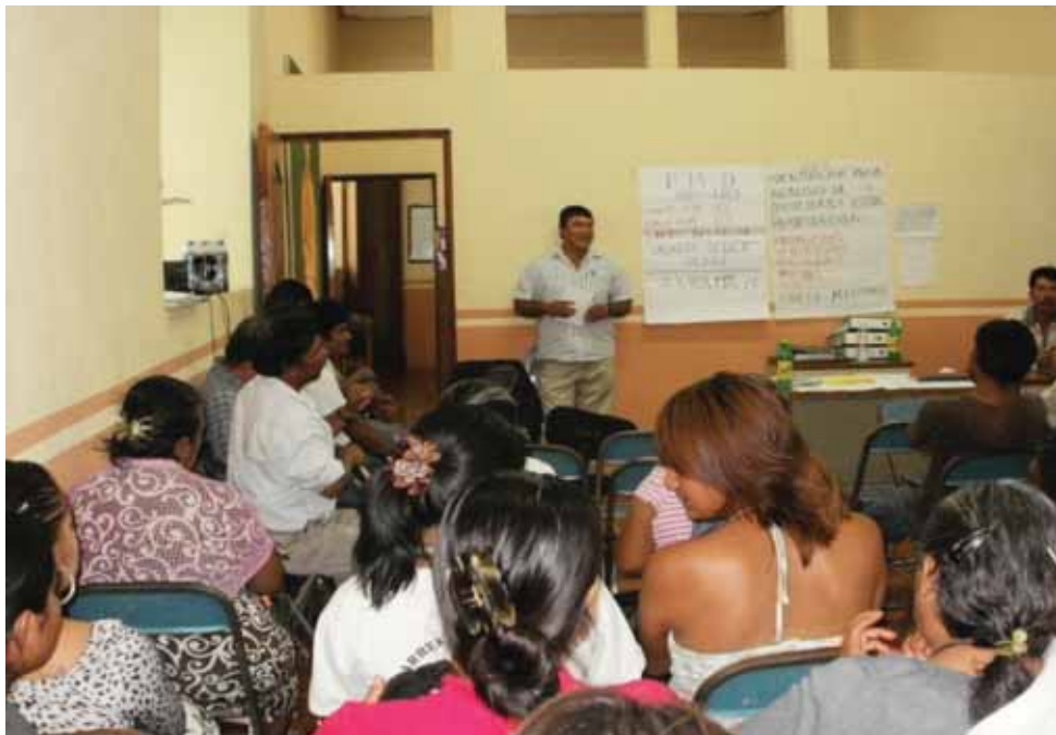
Reunión con el Consejo de Desarrollo Social Municipal par acordar la elaboración del PMDS (Intervención del Técnicoresponsable y Presidente Municipal)