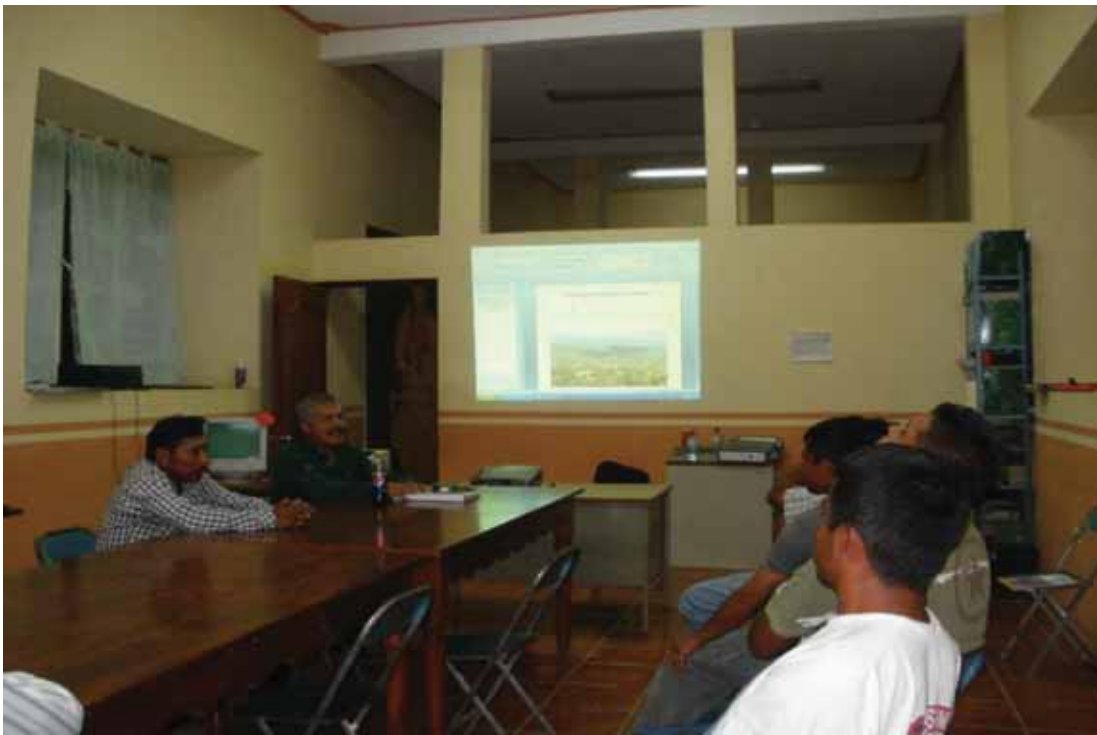
Presentación y validación del PMDS a los miembros del cabildo de San Jerónimo Silacayoapilla. (09-08-11)