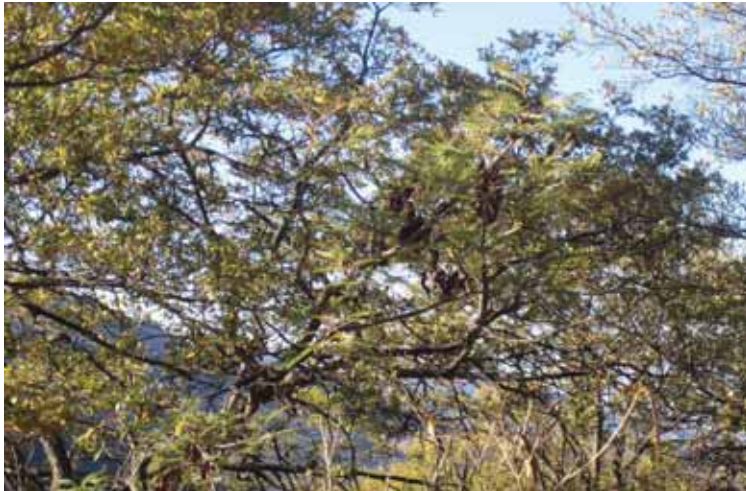
Monte bajo caducifolio

Bosque de Encino-Pino: Este tipo de vegetación está constituido por diversas especies de encinos que es el que prospera mejor y el de mayor dominancia en el Municipio. Los encinares cubren las laderas intermedias de las sierras y se extienden en muy altos rangos de altura prosperando los encinos en muy diferentes condiciones ecológicas, los cuales han sido objeto de un intenso disturbio provocado por la tala indiscriminada para obtención de leña, para uso doméstico, y por el extenso pastoreo sin control del ganado, también existen elementos arbustivos inferiores a 2 metros, destacando: uña de gato y Cazahuate.