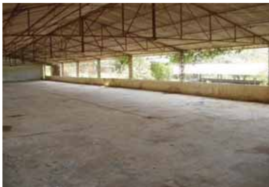
Instalaciones avícolas sin uso.