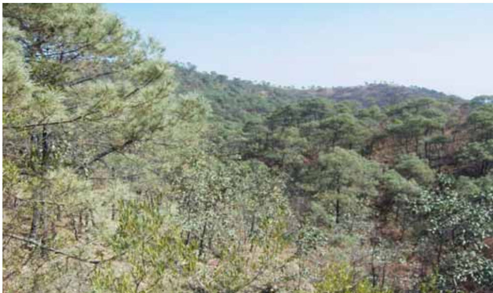
Bosque de Encino-Pino

Bosque de Encino-Pino: Este tipo de vegetación está constituido por diversas especies de encinos que es el que prospera mejor y el de mayor dominancia en el Municipio. Los encinares cubren las laderas intermedias de las sierras y se extienden en muy altos rangos de altura prosperando los encinos en muy diferentes condiciones ecológicas, los cuales han sido objeto de un intenso disturbio provocado por la tala indiscriminada para obtención de leña, para uso doméstico, y por el extenso pastoreo sin control del ganado, también existen elementos arbustivos inferiores a 2 metros, destacando: uña de gato y Cazahuate.