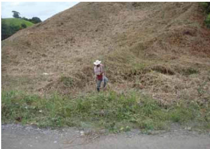
FIG. 2 Características de los suelos

De acuerdo a los análisis de suelos correspondientes, en la región se encuentran los siguientes: el 60% de suelos son conocidos como de cuarta y tercera clase (suelos de tepetate, rocosos), el 20% es de segunda (suelos de colorados) y 20 % de primera clase (suelos cercanos a las riberas de los ríos, suelos de tierra negra). El terreno en si es muy accidentado, principalmente el parte alta (montaña) donde bajo el esquema roza tumba y quema (RTQ) deforestan una parte del cerro entre 1 has a una tarea ( 12 metros de ancho por 12 metros de largo aproximadamente); en dicho espacio se siembra maíz, chile soledad e ixtle, principalmente el cual por la materia orgánica que existe les dura para producir dos cosechas o en algunos casos hasta dos años; es por eso que los habitantes se ven en la necesidad de que año con año cambian su lugar de cultivo sobre la montaña causando con esto mayor deforestación y erosión de las tierras. En las partes medias y bajas (lomeríos bajos) estos espacios "bajos el mismo esquema RTQ" se dejan y se convierten en pequeños potreros donde se establecen gramas nativas por lo general; ya en localidades donde la ganadería bovina predomina se establecen potreros con pastos mejorados (insurgente y señal).