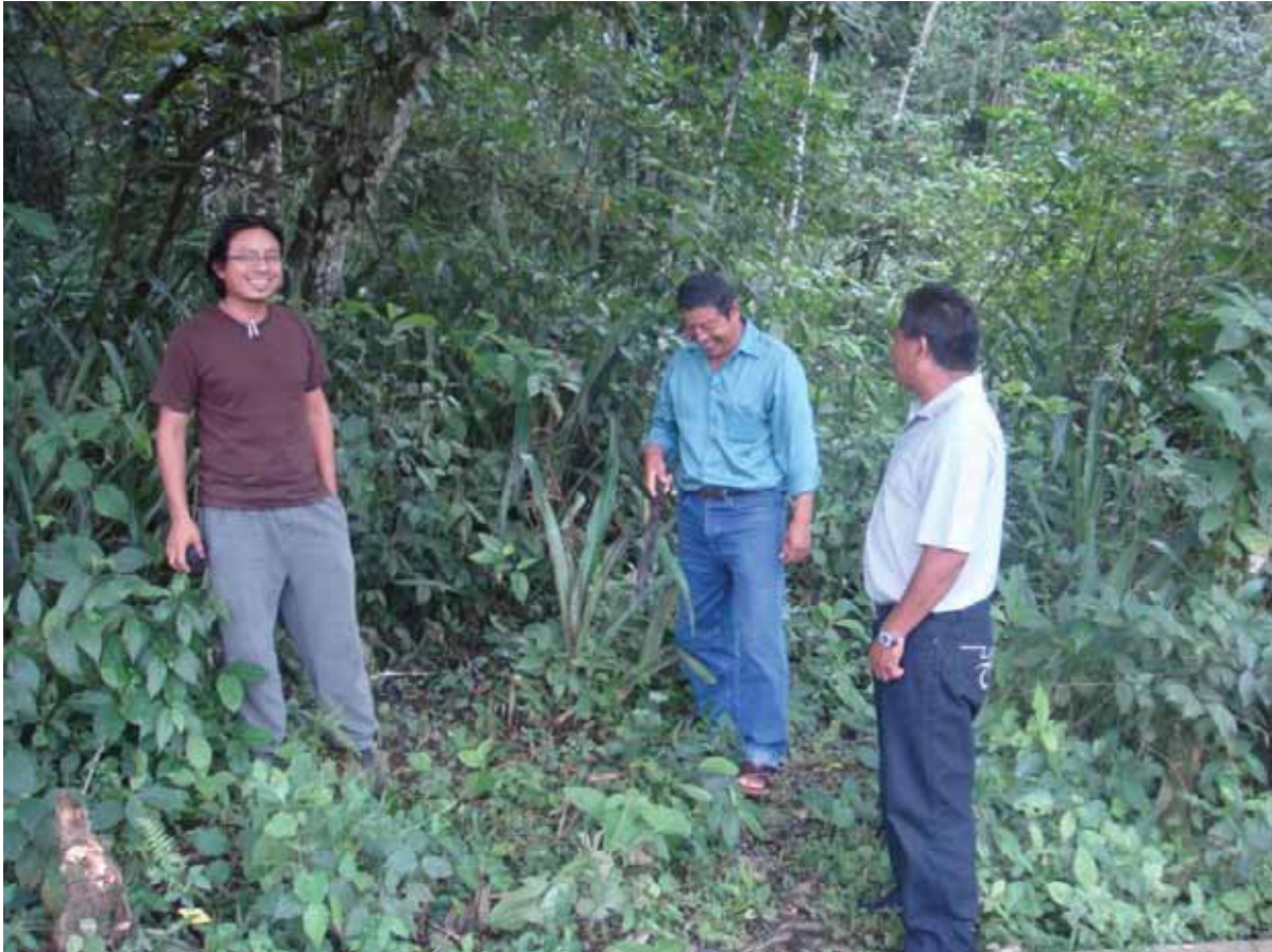
Cultivo de Ixtle

dedican a la actividad del bordado con esta fibra. Dependencias como la CDI y culturas populares han apoyado a este sistema producto otorgando recursos para el establecimiento de la producción del ixtle.