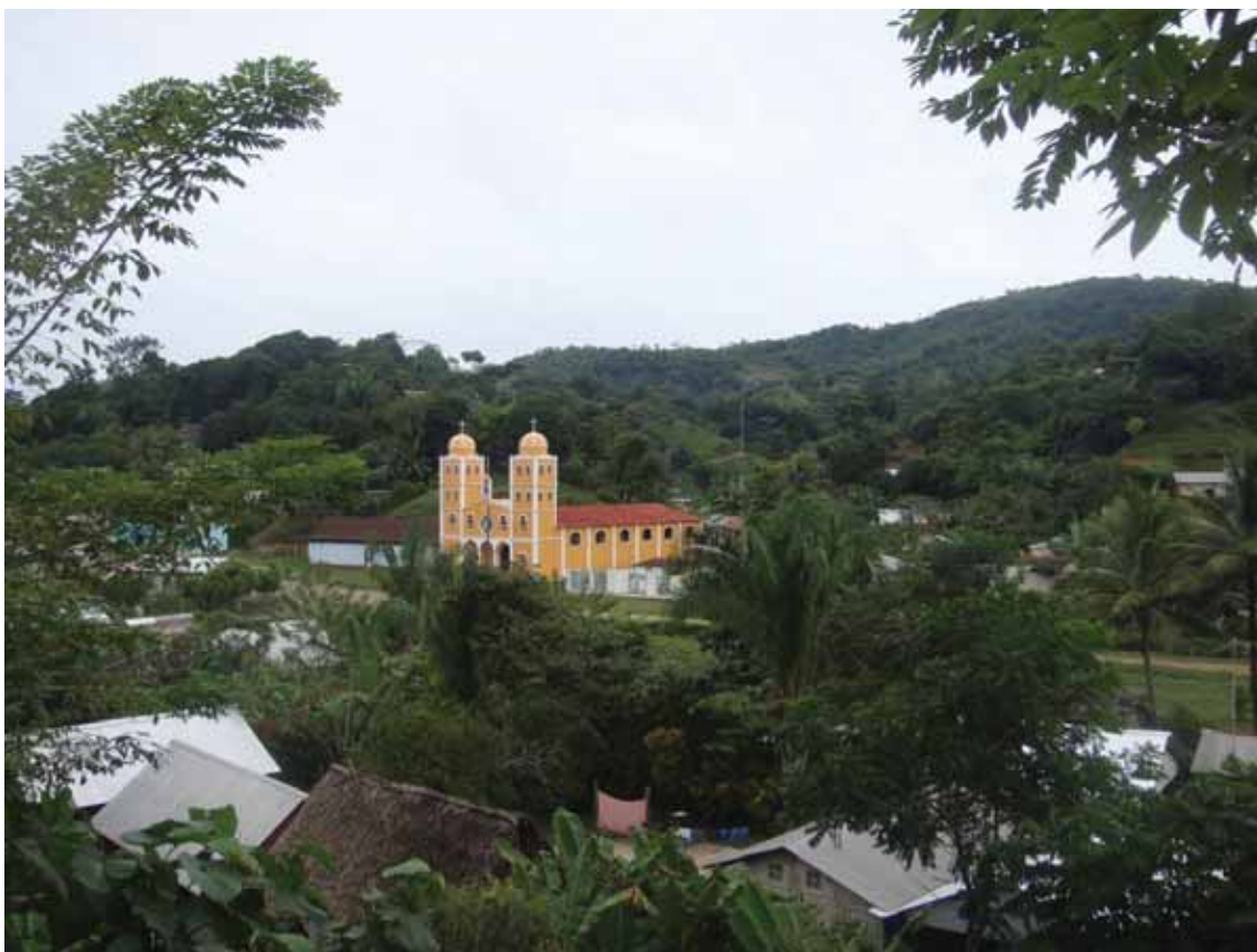
FIG. 8. Religiones en el municipio

RELIGIOSAS: más del 80% de la población se considera católica, por ejemplo en la comunidad de Asunción La Cova donde año con año es visitada la virgen de la Asunción por habitantes del lugar y personas de otros estados. Hace aproximadamente unos 10 años se llegaba a través de veredas o bestias mulares desde la cabecera municipal San Juan Lalana; jornadas de 3 a 4 horas hacían los así creyentes por realizar un manda o promesa; en la actualidad solo se realizan 30 minutos de camino pues ya está en construcción el camino de acceso hasta dicha localidad, otros templos visitados son los de San Juan Lalana y Santiago Jalahui. Todas estas construcciones fueron realizadas generalmente por el pueblo en tequio o faenas. El 20% de la población del municipio pertenece a grupos evangélicos, Pentecostés y Príncipe de Paz; localidades como San Juan Evangelista se caracterizan por que toda la población se congrega en el templo del Príncipe de Paz.