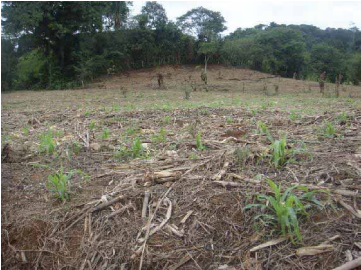
FIG. 3 Características de los suelos