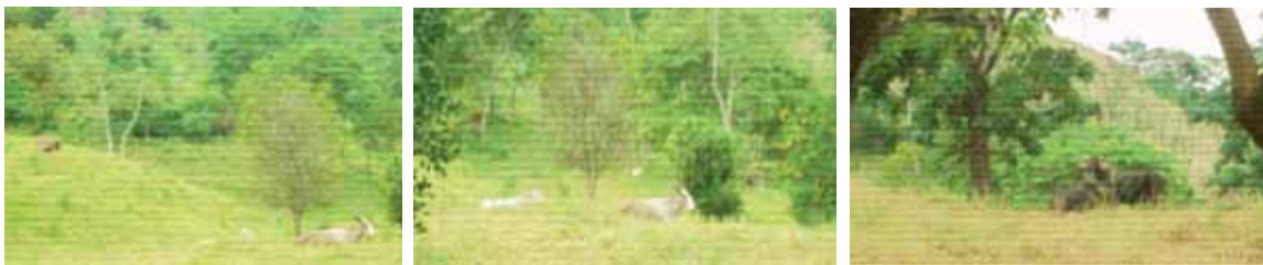
FIG. 17. Ganadería bovina extensiva

Manso se practica la ganadería de doble propósito, se vende leche bronca y se elaboran quesos; aproximadamente el 20% de los ganaderos en todo el municipio y un 10% de los ganaderos trabajan el sistema semi estabulado son los que ofrecen algún suplemento alimenticio. Esta actividad es la que genera empleos fijos y algunos otros temporales; genera otros servicios como son: la renta de flete para el traslado de los animales, pago de facturas y guías de traslado de sus animales. En este sentido existen ganaderos de baja escala , que por lo general tienen ganado “a medias”, rentan sus potreros o unidades de producción, a un “mediero” quien es el dueño de los animales, estos son los que se llevan la mayor parte de las ganancias, desafortunadamente no tienen otra opción, ya sea por tradición o por falta de recursos para tener ganado propio; ganaderos en transición , estos ya cuentan con ganado propio, llevan esta actividad más controlada tanto en la ganadería de doble propósito como en el ganado en gorda exclusivamente; los grandes ganaderos son personas que se dedican de manera intensiva a esta actividad, ya sea a la engorda de novillos o al sistema de producción de doble propósito, por lo general estos últimos son “medieros o coyotes” los cuales acaparan el mercado y fijan los precios de venta del ganado. La parte baja del municipio como son las agencias de Boca de Piedra, San Lorenzo, Colonia Morelos, Montenegro, Villa Nueva y San José