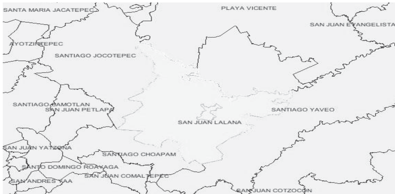
FIG. 1. Mapa del municipio de San Juan Lalana, Oax

Pertenece a la provincia Sierra Madre del Sur (53.59%) y llanura Costera del Golfo sur (46.41%); a la sub provincia Sierras Orientales (53.59) y llanura Costera Veracruzana (46.41%); con un sistema de topo formas de sierra alta compleja (53.59%) y lomerío típico (46.41%).