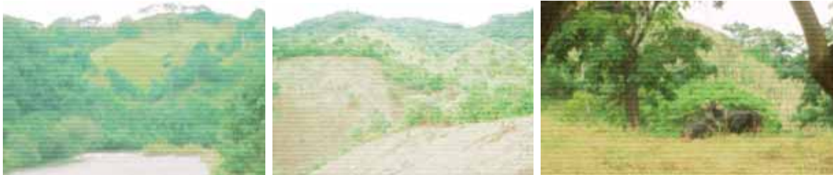
FIG. 3: Diferentes paisajes del municipio de San Juan Lalana.

En las partes altas como Cerro Progreso, Asunción La Cova, San José Arroyo Copete, La Carmelita, San Juan Evangelista, San Pedro Tres Arroyos, Santa María La Nopalera, Nuevo san Antonio todavía se pueden apreciar los venados, tigrillos, mazates, armadillos o toches. En la localidad de Santiago Jalahui por mandato del pueblo se tiene prohibido la casa, la pesca y la deforestación de la selva, San Pedro Tres Arroyos esta en ese proceso de poner veda de pesca, casa y al cuidado de la selva.